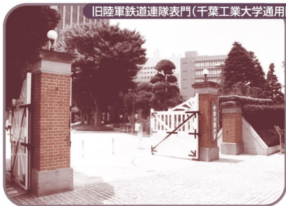
旧陸軍鉄道連隊表門(千葉工業大学通用門)