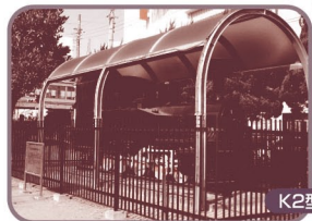
K2型蒸気機関車(津田沼一丁目公園)