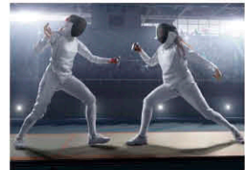
フェンシングの基盤は騎士道の精神

頭脳的な駆け引きや間合いを詰めた接近戦など、スピーディーな試合運びと精密で華麗な技が見どころ。静寂に包まれた会場で繰り広げられる激しい攻防は、瞬きも許されないほどの一瞬で勝負が決まる緊迫感に満ちています。