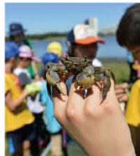
干潟にふれあえる幸せ