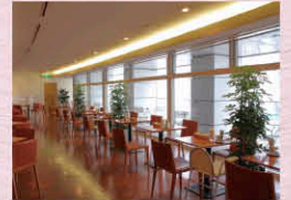
レストラン「アザリア」