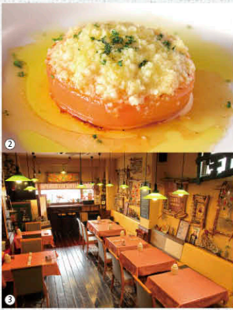
①「本日のおまかせ前菜8種盛り」980円。ナスのトマト煮、白レバーのムース、つぶ貝のポテトサラダなど、その日おすすめの前菜がバランスよく楽しめます。4種盛り490円も。②「ニンニクたっぷり焼きトマト」1個300円。その名の通りニンニクをたっぷり使った一品。焼くことでトマトの甘さもアップ、バゲットと一緒に召し上げ。③流木やコルク、ワイヤーを使った手作りのオブジェが飾られた店内。