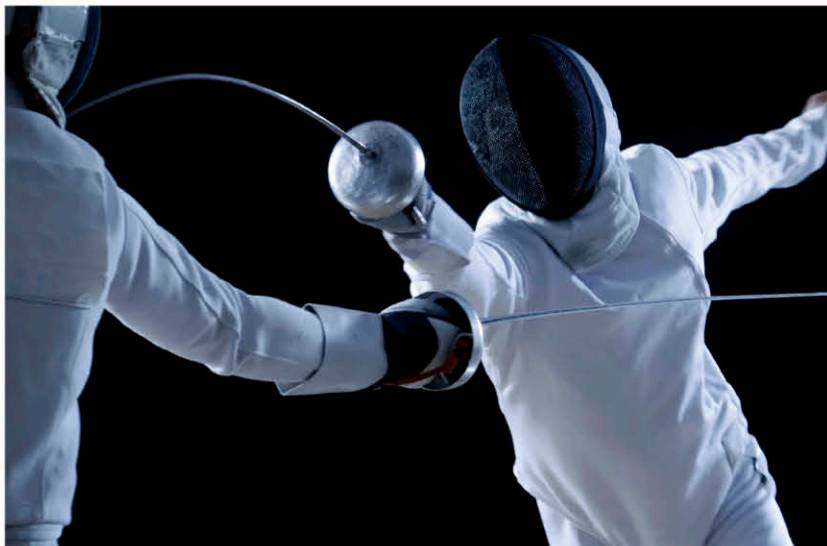
フェンシングはフルーレ、エペ、サーブル共にポイントの獲得によって勝敗が決まります

フルーレには、先に攻撃を仕掛けた選手が攻撃する権利を得る「優先権」があります。相手は攻撃を防御することで優先権を奪取でき、攻防が瞬時に変わっていく試合展開が見られます。