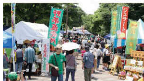
干潟の恵みを味わう幸せ