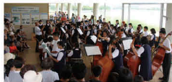
干潟の景色と音色を奏でる幸せ