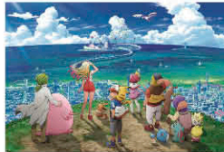
©Nintendo・Creatures・GAME FREAK・TV Tokyo・ShoPro・JR Kikaku ©Pokémon ©2018 ビカチュウプロジェクト

7月13日(金)公開 監督:矢嶋哲生 声の出演:松本梨香、大谷育江、林原めぐみ、三木眞一郎 ほか